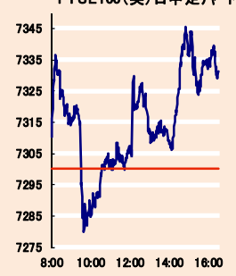
(ポイント) FTSE100(英) 日中足チャート