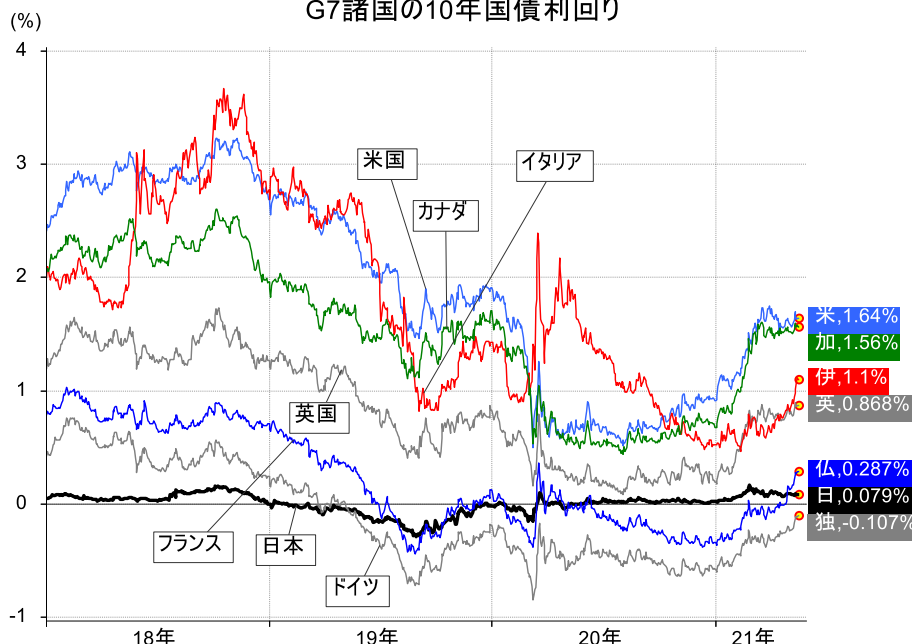
G7諸国の10年国債利回り

作成: 岡三証券 2018年年初～2021年5月18日(値が無い場合は直近値)