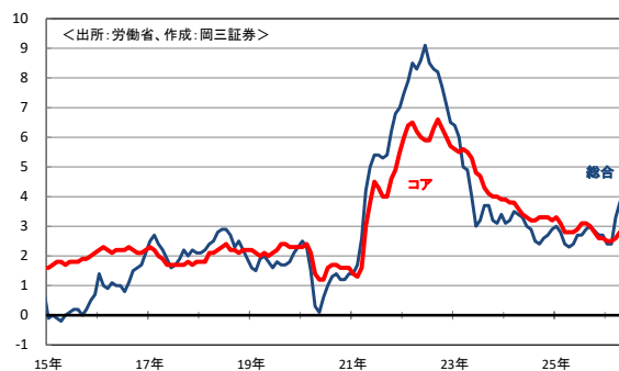
消費者物価指数の推移(前年同月比)